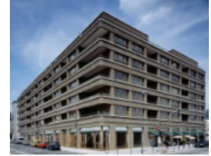
Westgarten in Frankfurt/Main