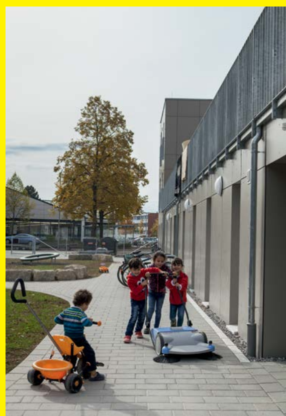
Gemeinschaftsunterkunft Reutlingen, 2016 Collective accommodation Reutlingen, 2016