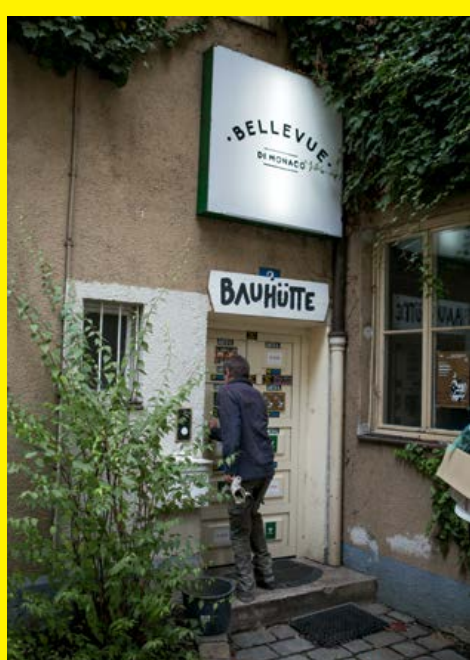
Bellevue di Monaco, Bürgerinitiative „Wohnen und Starthilfe für Flüchtlinge“, München, 2016 Bellevue di Monaco, citizens' initiative "Housing and Initial Aid for Refugees", Munich, 2016

Accompanying the exhibition there will be an extensive supporting program ( www.dam-online.de/events ).